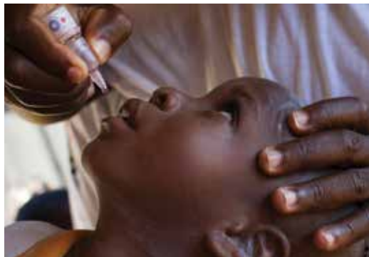
扶輪社員在奈及利亞，為兒童投小兒麻痹疫苗。

扶輪社員和友人的慷慨捐獻讓我們為有需求的社區提供有持續性的改善。如您有意支援扶輪基金會，請詢問貴社的扶輪基金會主委，或者上網 rotary.org/donate 瞭解方法。更多的詳情可自 The Rotary Foundation Reference Guide (扶輪基金會參考指南) 下載，或在扶輪網站的 Learning Center (學習中心) 學習有關扶輪基金會的基礎課程。