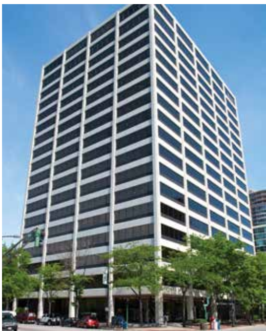
美國伊利諾州Evanston 的總部大樓：One Rotary Center

國際扶輪的秘書處履行扶輪行政管理業務。由秘書長領導的秘書處有將近800名的雇員為世界各地的扶輪社和地區提供業務支援。扶輪的世界總部處於美國伊利諾州艾凡斯敦的One Rotary Center大樓。其中有可容納190個座席的禮堂；扶輪資料庫；召開RI理事會及扶輪基金會保管委員會會議的會議室；RI社長、社長當選人及社長提名人的辦公室和其他資深雇員的辦公室。此外還有