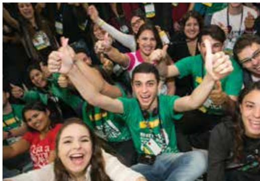
扶輪請年服務團團員相聚於扶輪年會前會議。

我們以提升青少年領導人的能力，幫助他們學習領導技能和經驗不同的文化，為我們的未來進行投資。