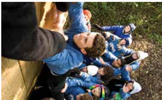
RYLA活動指導青少年有關服務和領導力的重要。

扶少團和扶青團都由近處的扶輪社輔導。請洽貴社的領導人如何參與協助扶少團和扶青團的工作。