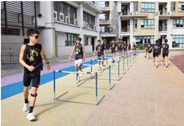
達觀國中小田徑體育班學生訓練

員、尖山國中及達觀國中小體育班組長討論溝通，從第一線教學與訓練實務點出發，提供最實際的專業建議，評估學生人數、訓練項目與場地現況，讓捐贈器材與防護設備能真正符合教學需求，並可長期、安全地使用於訓練現場。