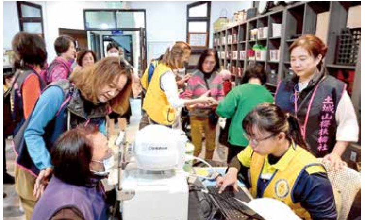
本社社友們親手做服務，協助鄉民進行健康檢查

同時，山櫻社社友們親赴宜蘭縣大同鄉寒溪村，與醫療團隊共同展開醫療服務，協助居民進行血糖、膽固醇及心電圖等檢測，讓健康照護不再需長途奔波，而是能在社區中持續進行。