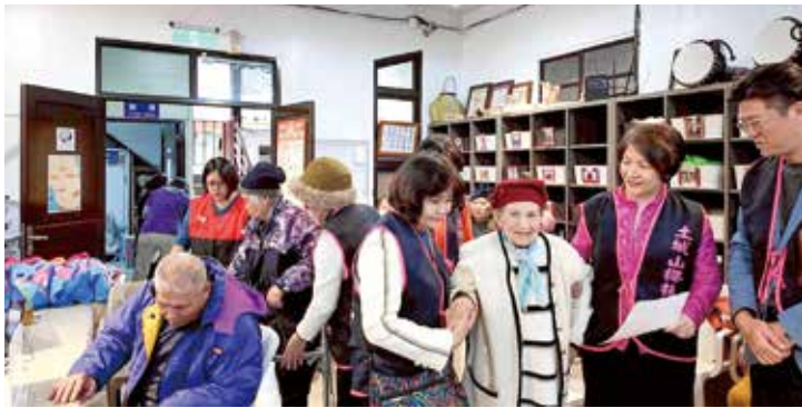
扶輪社友採取行動服務深入偏鄉傳遞愛與關懷

扶輪強調「People of Action」，公益價值不僅在資源投入，更在親身參與。社友們現場引導居民、協助操作設備、說明檢測結果並給予關懷，使醫療服務不只是流程，更充滿人情溫度。